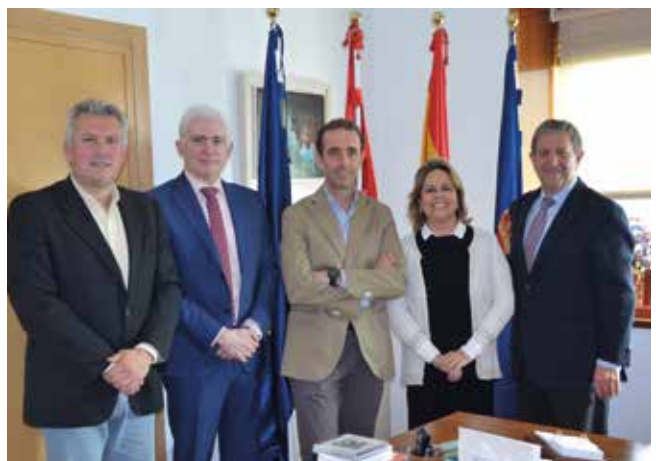
▲ Responsables municipales y del COEM.

Este año el COEM celebra su IV Campaña de Salud Bucodental que, en esta edición, está centrada en el cuidado y la limpieza de la lengua. Será difundida en los centros escolares del municipio con la colaboración del consistorio.