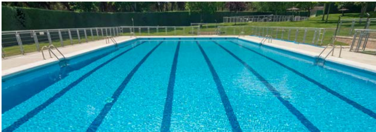
▲ Piscina Municipal de Verano.