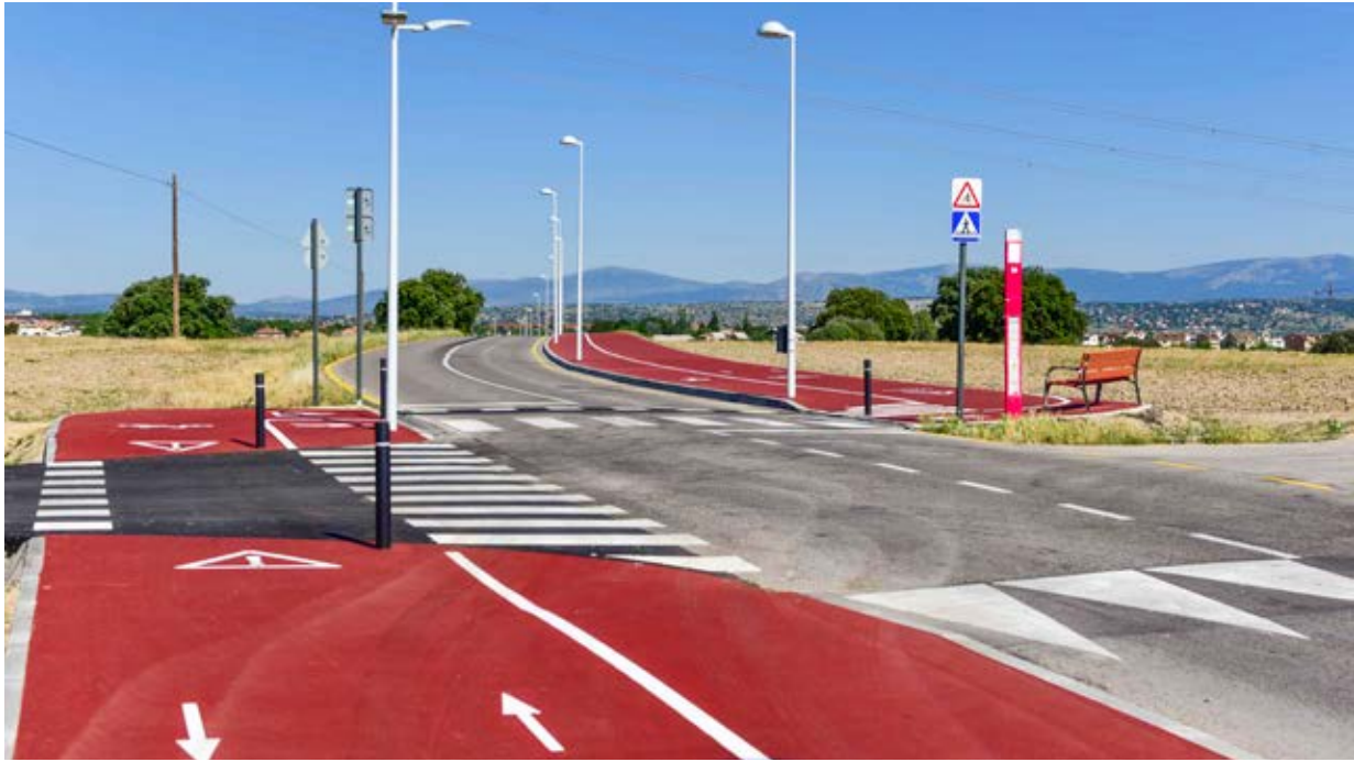
▼ ▲ Imágenes de la senda y de la visita institucional tras la finalización de las obras.