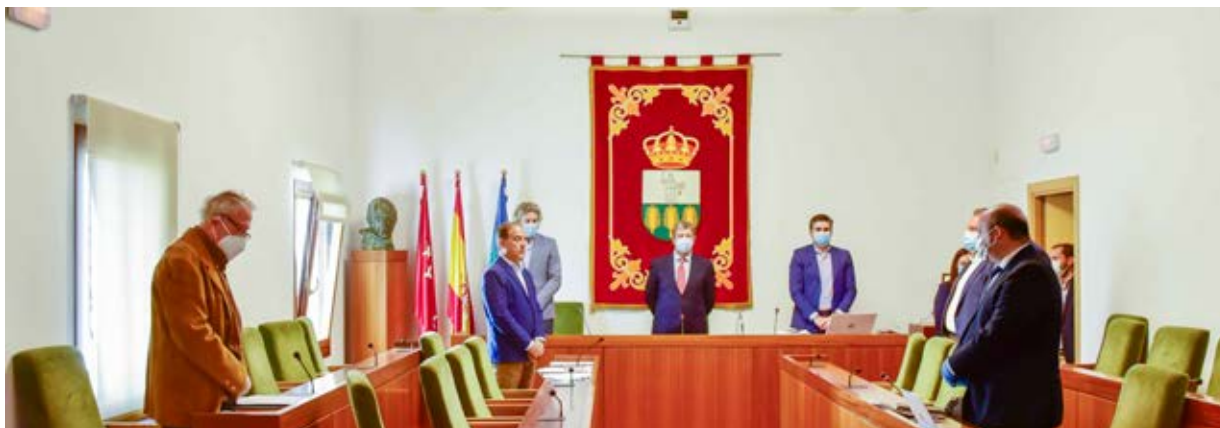
▲ Minuto de silencio en homenaje a las víctimas del COVID-19 en la primera sesión del Pleno celebrada tras decretarse el estado de alarma.