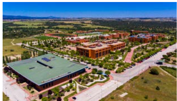
▲ Campus de la UAX.

Los vecinos empadronados que cursen un ciclo de Formación Profesional en la modalidad presencial tendrán bonificaciones, en virtud del convenio de colaboración entre el Ayuntamiento y el Centro de FP Alfonso X el Sabio. En concreto, una ayuda al estudio del 20% en las tasas de la enseñanza, y una ayuda del 100% en las tasas de las pruebas de admisión (si las hubiere). Los ciclos ofertados son: Enseñanza y Animación Sociodeportiva; Administración y Finanzas; Marketing y Publicidad; Desarrollo de Aplicaciones Multiplataforma y Administración de Sistemas Informáticos en Red. Para optar a las ayudas, el solicitante deberá acreditar que la unidad familiar a la que pertenece está empadronada en el municipio con una antigüedad mínima de un año, así como al corriente de pago de sus obligaciones tributarias con el Ayuntamiento. El plazo de matriculación finaliza el 20 de septiembre. Más información, a través del teléfono 91 910 01 70 y de la web www.uax.es/fps/presencial