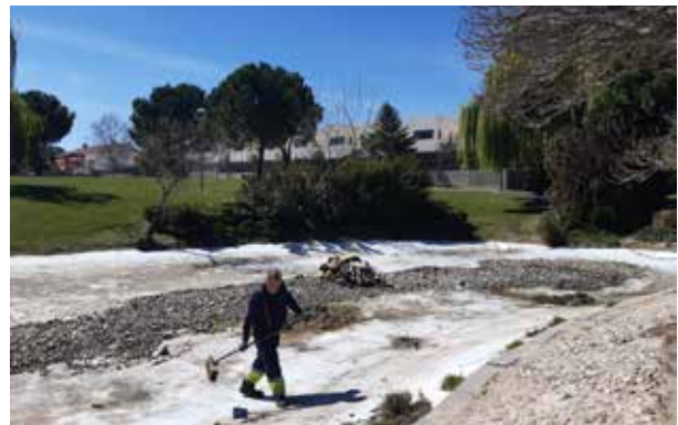
▲ Operario realizando labores de limpieza en el estanque.

La laguna artificial aprovecha la vaguada natural de La Baltasara, un parque urbano de más de dos hectáreas de superficie que linda con El Pinar y que contiene más de 50 especies florales, lo que lo convierte en un mini jardín botánico.