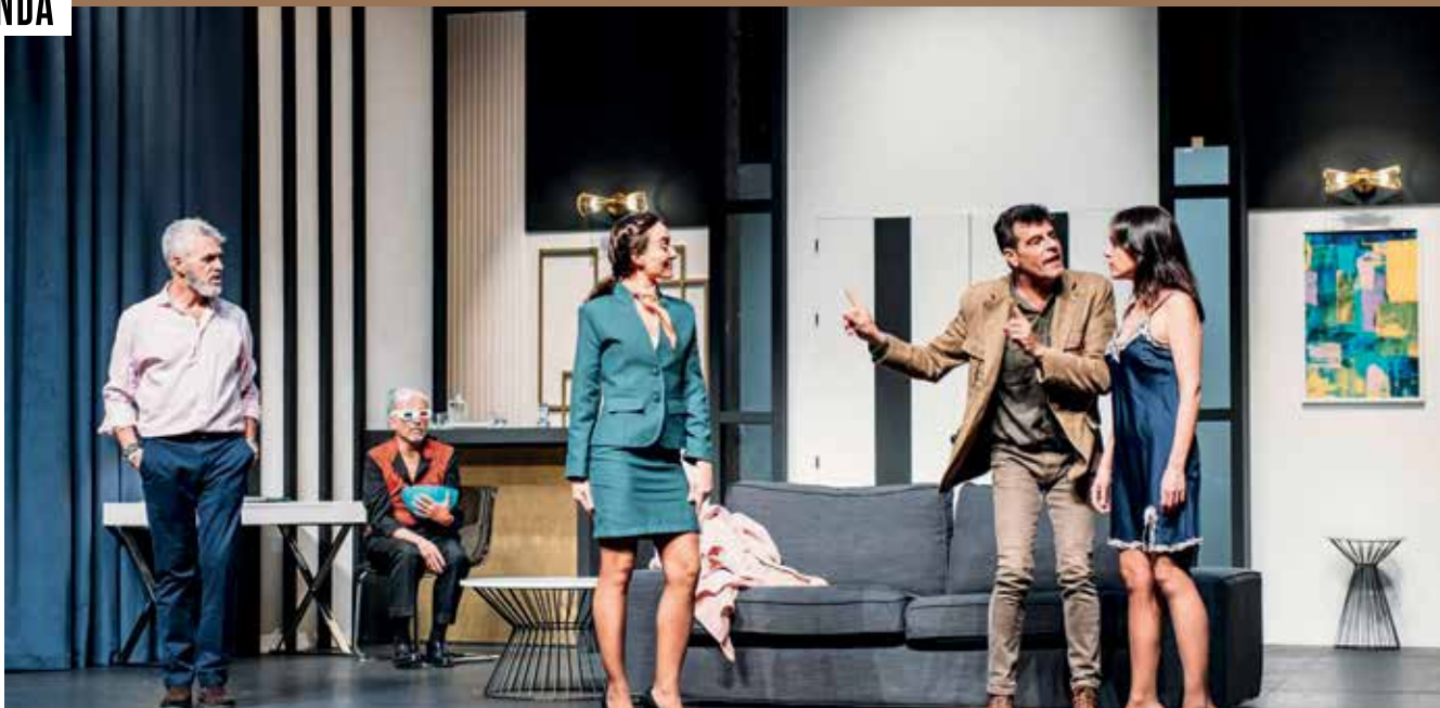
▲ Escena de "Boeing Boeing". montselozano.com