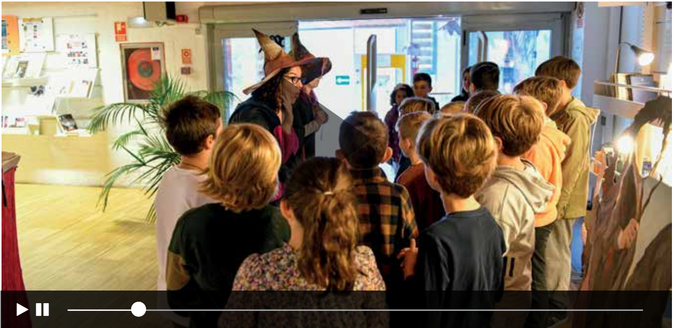
▲ Participantes en el escape room "Viaje a Hogwarts".